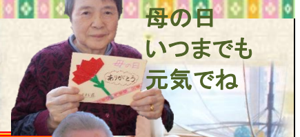
母の日 いつまでも 元気でね