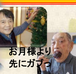
お月様より先にガマッ