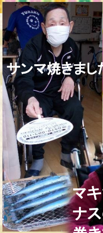
サンマ焼きました